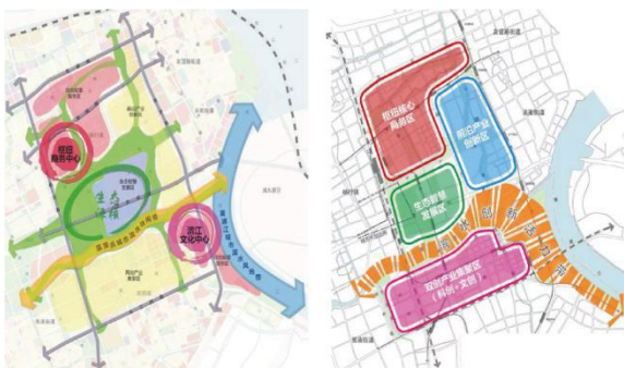
(规划结构及功能分区示意图)

吴淞创新城力求打造“一核两心、两带五区”的规划格局（承载规划建筑总量约 2500 万平方米）：