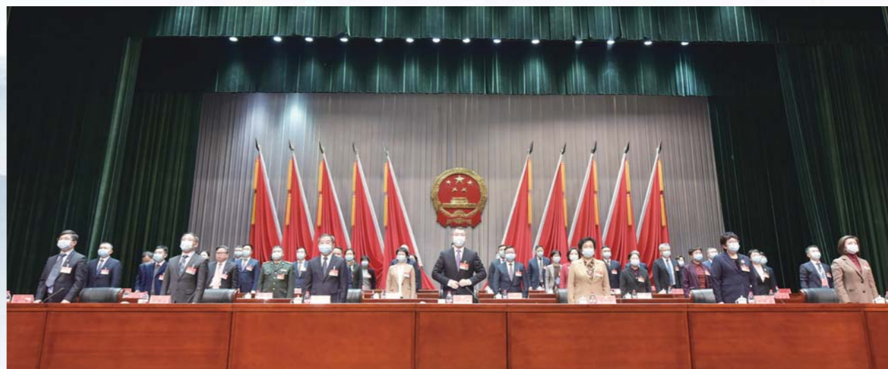
大会在国歌声中闭幕