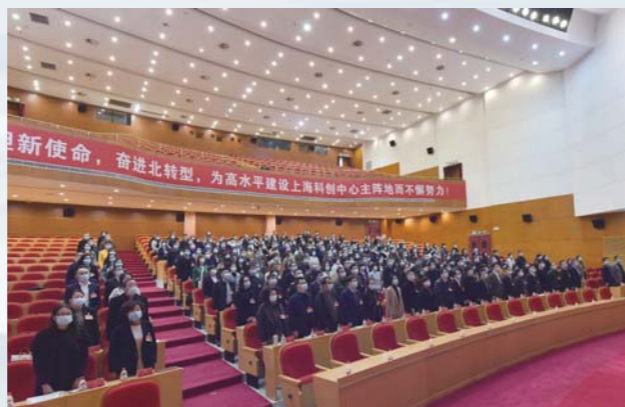
奏唱国歌，大会开幕