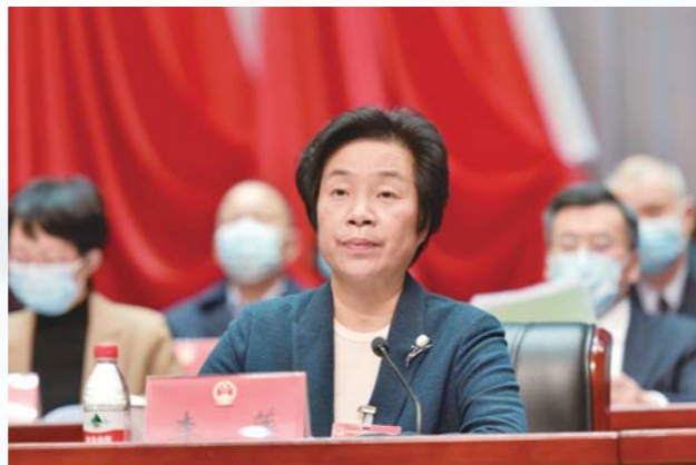
区人大常委会主任李萍主持开幕式