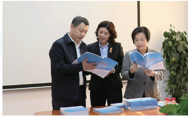
听取基层立法联系点工作介绍