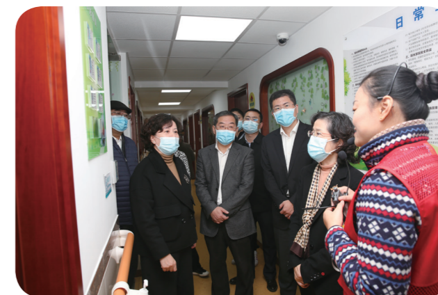
视察张庙街道阳光家园