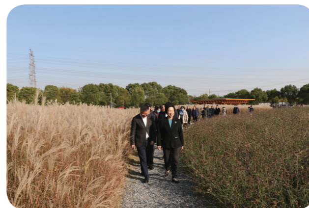
视察月狮村新农村