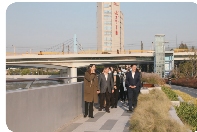
视察北上海科创湾