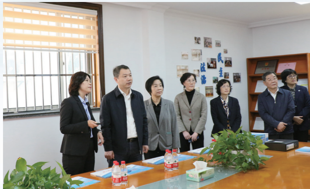
实地察看基层立法联系点——区劳动人事争议仲裁院