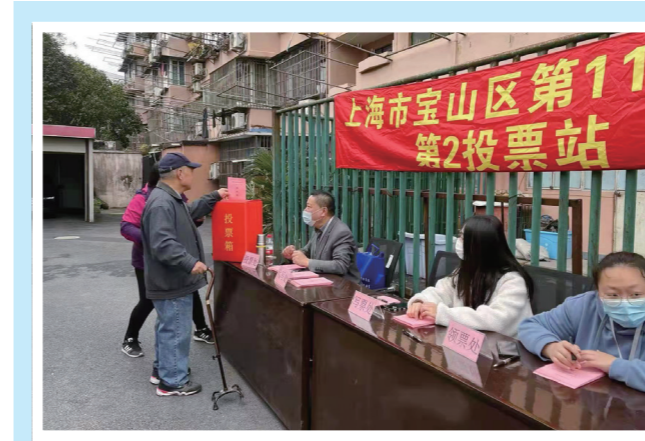
▲ 工作人员分发选票