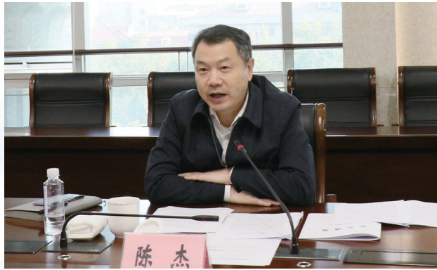
区委书记陈杰讲话

2021年11月15日，区委书记陈杰专题调研人大工作，先后到市人大常委会设在宝山区劳动人事争议仲裁院的基层立法联系点和友谊路街道代表之家宝林片代表联络站，实地察看基层立法联系点、代表家站点建设情况，并指导人大代表换届选举张榜工作。座谈听取有关情况汇报。