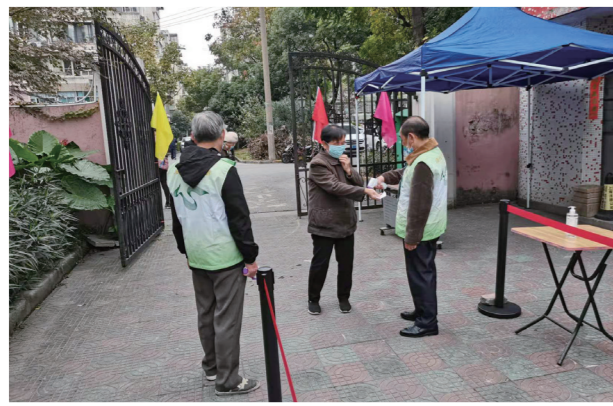
▲ 工作人员引导选民进入投票站点