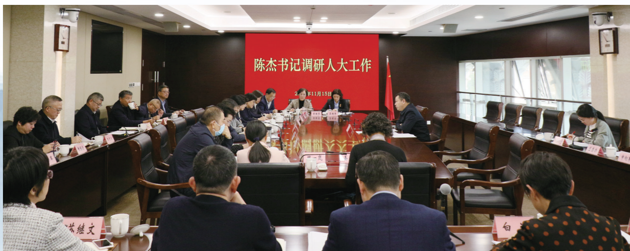
座谈听取工作汇报