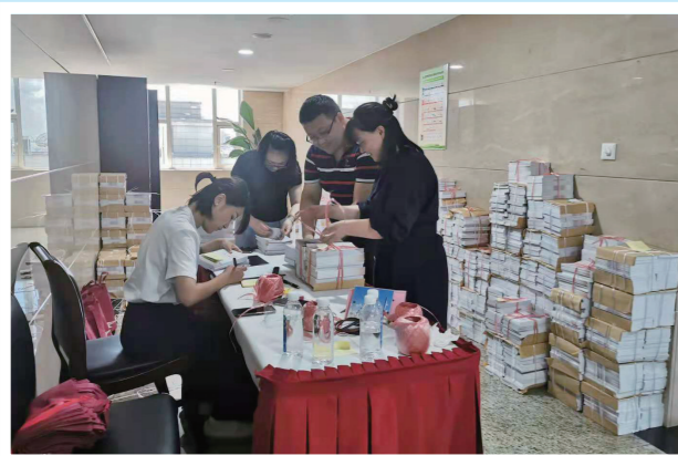
▲ 区选举办分发选举工作有关书籍