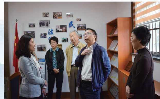
实地察看基层立法点——宝山区劳动人事争议仲裁院

2021年10月28日，市人大社会委来宝山区劳动人事争议仲裁院基层立法联系点就《工会法（修正草案）》征求意见开展调研，并召开座谈会。