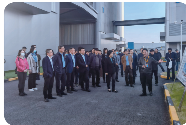
听取 S7 沪崇高速建设情况介绍