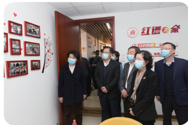
视察张庙街道公共客厅