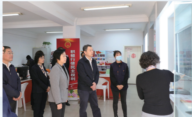
实地察看宝林片代表联络站