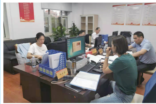
▲ 区选举办研究各选举工作组选民情况排摸情况