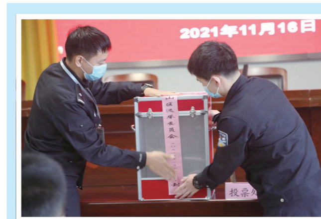
▲ 工作人员检封票箱