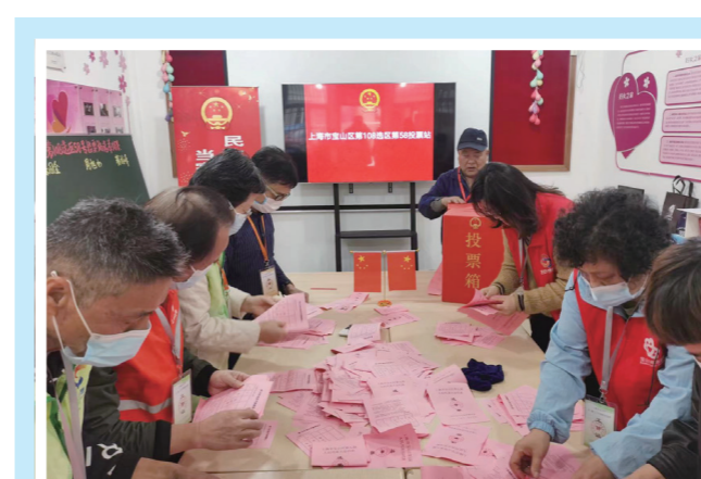
▲ 工作人员清点选票