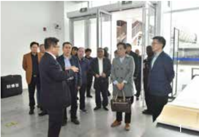
1、考察吴淞口国际游轮港

2019年5月8日下午,内蒙古自治区人大副主任和彦苓一行就宗教、外事工作来宝山调研并开展交流。