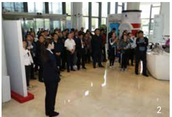
2、参观吴淞口国际游轮港