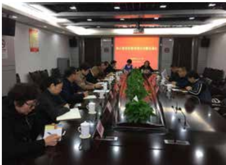
海江路世纪联华协调会

根据友谊路街道辖区的地域特点，38 个居委会与 21 名区人大代表无法做到一一对应联系，结合这样一个实际情况，街道人大工委通过 3 个片区工作站的形式（宝钢片代表工作站、宝山片代表工作站、宝林片代表工作站），增设 38 个居委的人大代表信箱作为信息接收窗口，来弥补这一空缺，实现人大代表联系居民区全覆盖，主要是以代表小组方式接待选民，为代表履职、联系选民搭建工作平台，优化了代表接待选民的环境，同时也充分发挥了代表在本选区内作用。