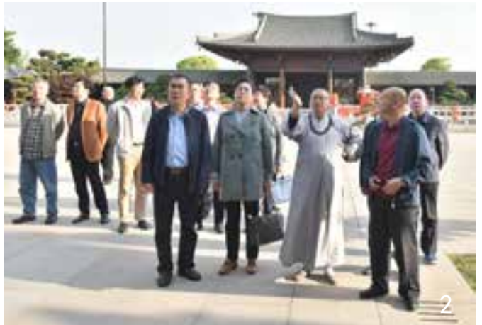
2、调研外事工作情况