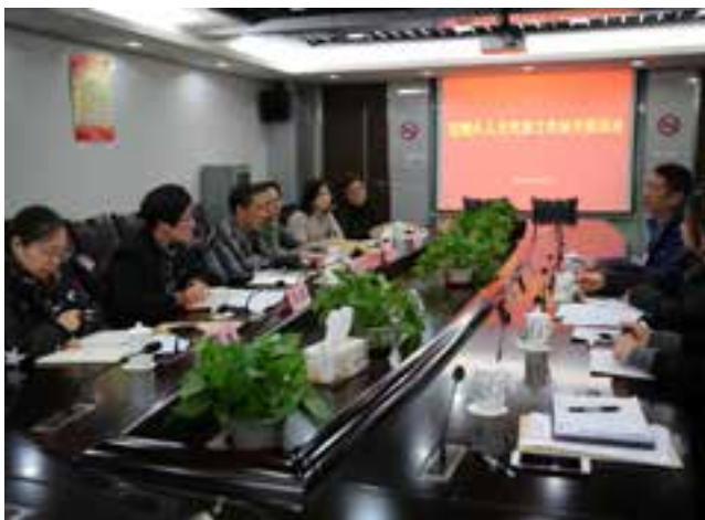
宝钢片人大代表工作站开展活动