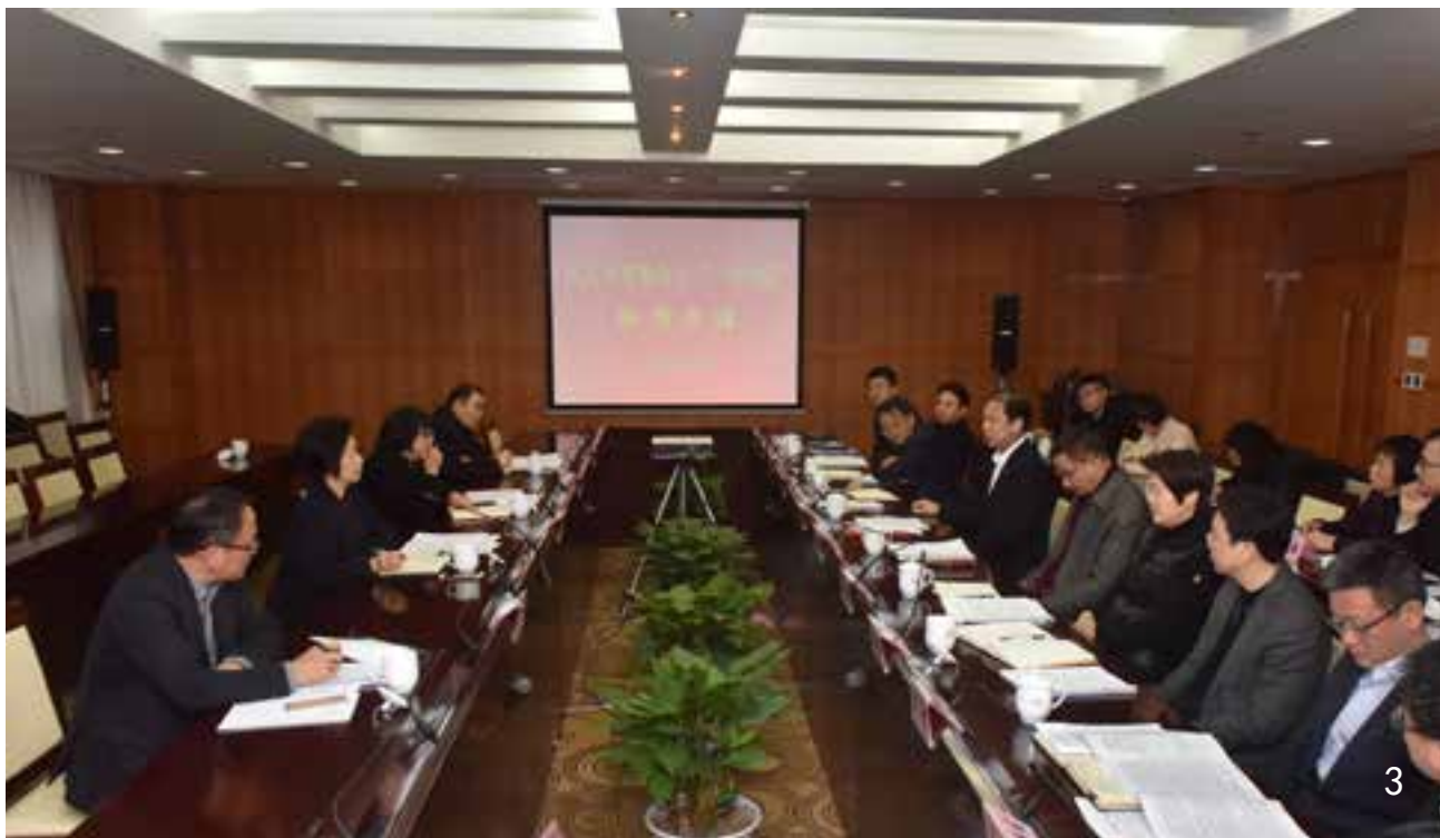
3、区人大常委会和“一府两院”领导进行交流