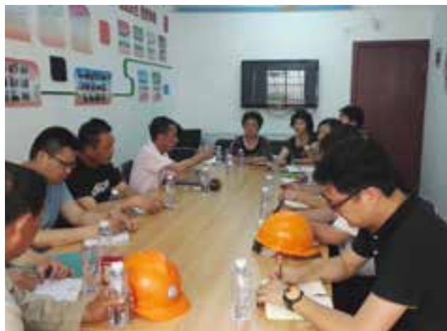
友谊路街道宝林片人大代表工作站开展活动

友谊路街道人大工委将人大代表工作站建设为“服务群众 推动发展”的前沿阵地，把代表提出的意见建议和解决群众反映的问题作为巩固活动成果的重中之重，切实促进活动成果转化，推动问题的解决，提升了人大代表在人民群众心目中的地位，调动了人大代表履职的积极性，进一步完善代表工作机制，促进代表在闭会期间活动的常态化。