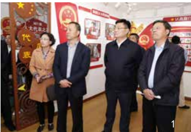
1、调研基层代表工作

2019年5月7日下午,吉林省人大代表培训班一行100余人到宝山开展现场参观和学习交流,市、区人大及有关镇人大同志陪同。