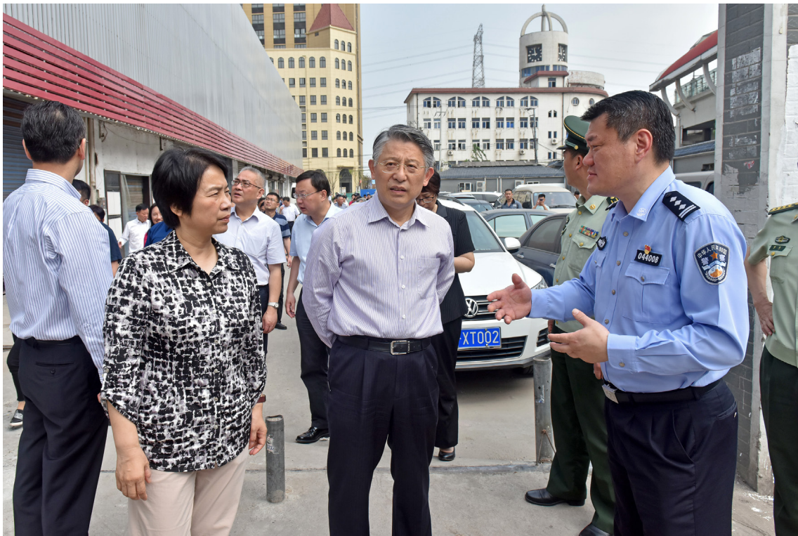
2018年5月18日，市人大常委会副主任沙海林来宝山调研