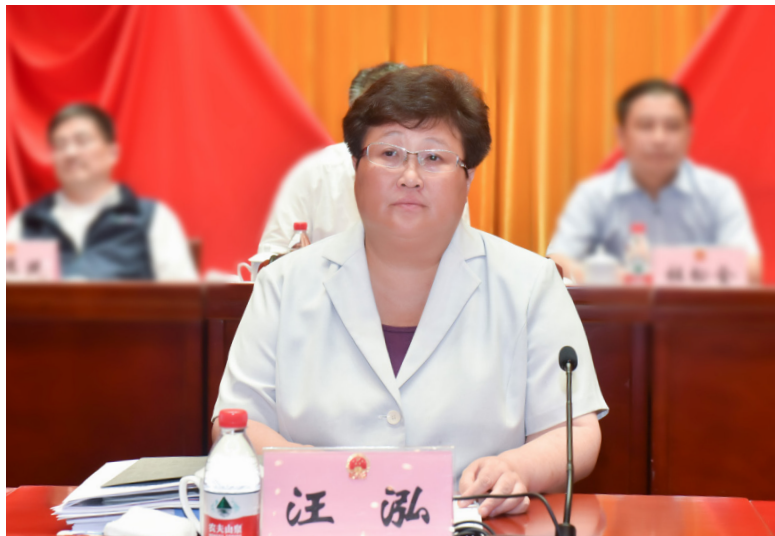
区委书记汪泓 出席大会