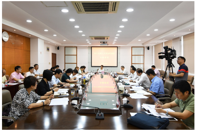
2018年7月26日上午，市人大宝山代表组评议市政府上半年工作