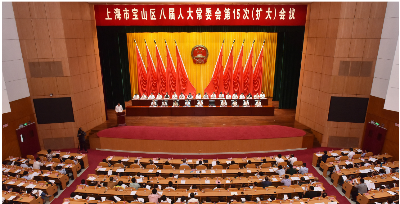
2018年7月26日下午，宝山区八届人大常委会行举行第15次（扩大）会议