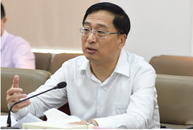
市人大代表、市人大常委会副主任莫负春发言