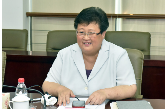
市人大代表、区委书记汪泓发言